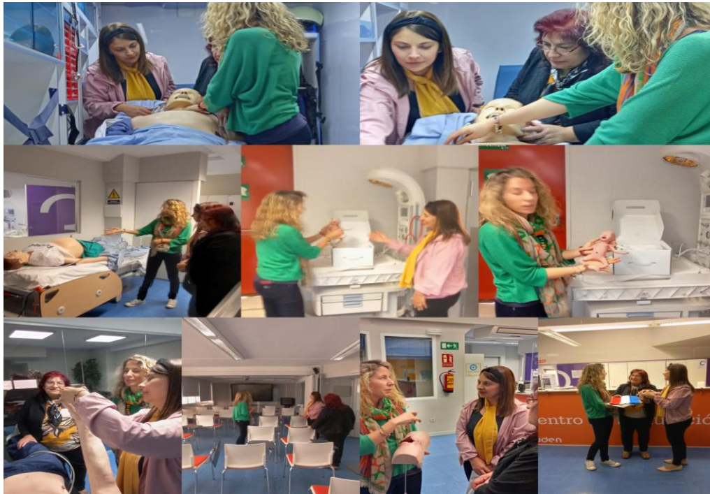
Centro Simulación Clínica FUDEN Madrid España