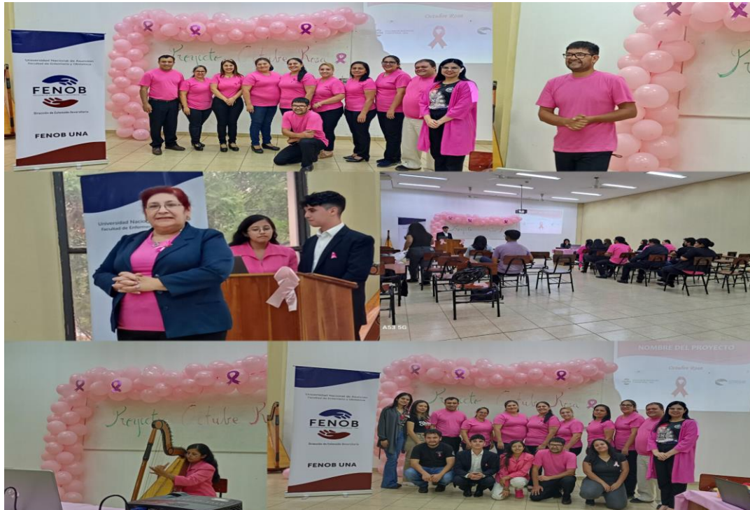
Proyecto de Extensión Universitaria Octubre Rosa