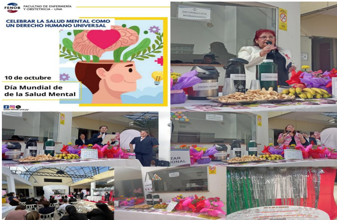
Proyecto de Extensión Salud Mental